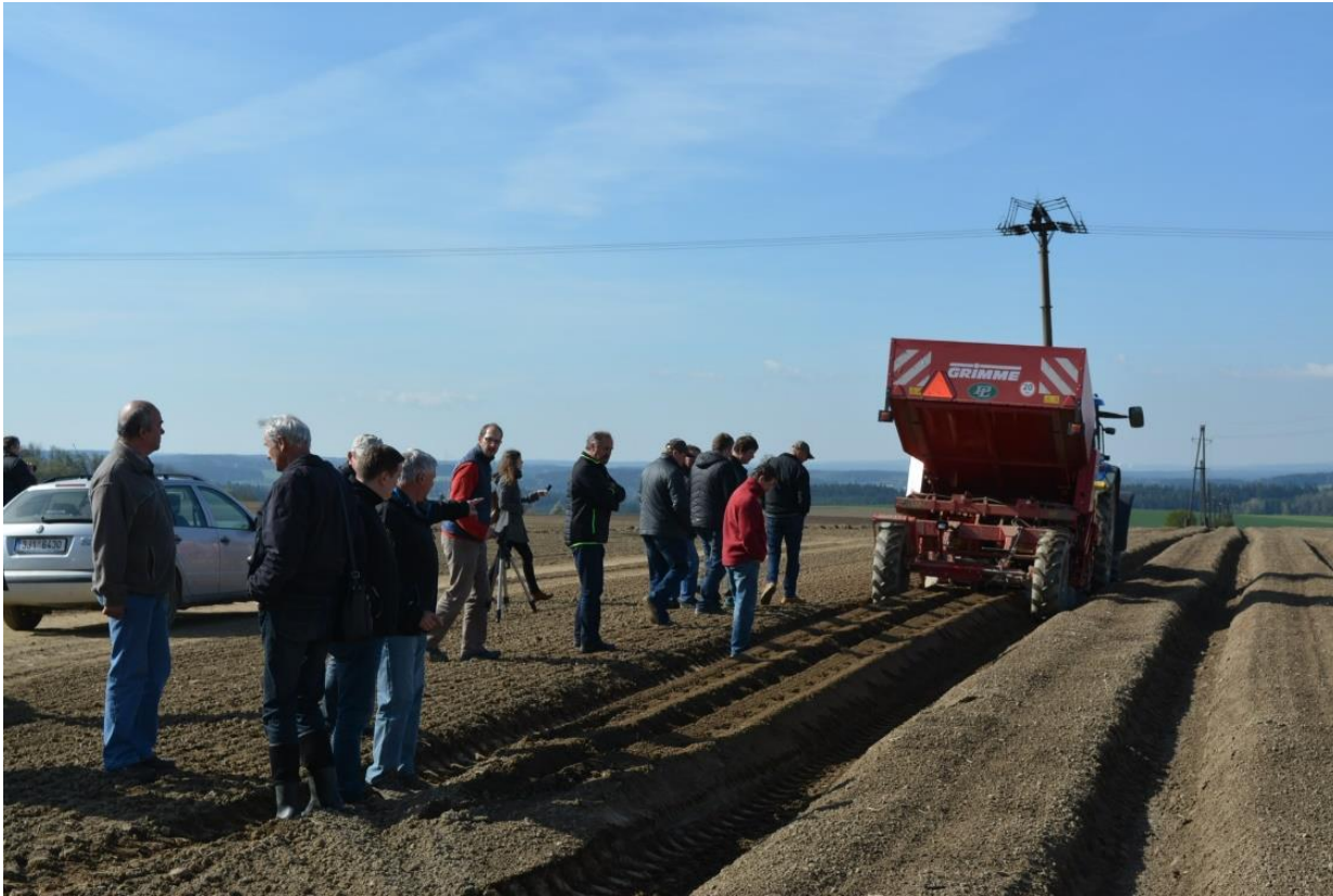
VESA Česká Bělá